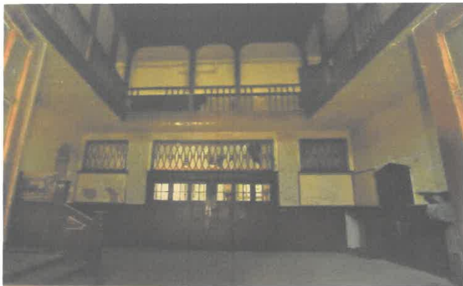
Zdjęcia wykonane przed remontem