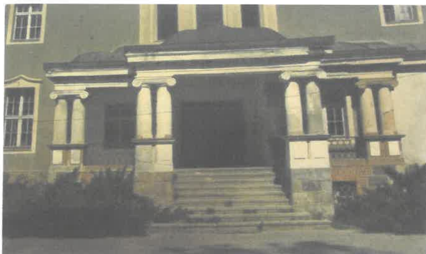
Zdjęcia wykonane po remoncie