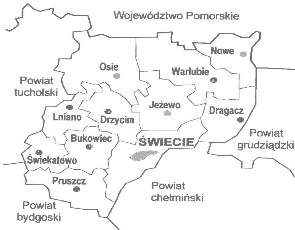
Rys.2 Gmina Drzycim w powiecie świeckim

Zachodnia część Drzycimia to osiedla domków jednorodzinnych. Pozostała zabudowa to zabudowa zagrodowa część o funkcji związanej z rolnictwem, to siedliska gospodarskie usytuowane wzdłuż ciągów dróg.